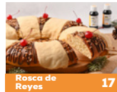
Rosca de Reyes 17