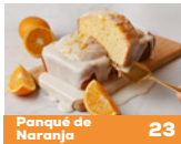
Panqué de Naranja 23