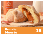
Pan de Muerto 15