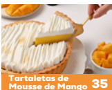
Tartaletas de Mousse de Mango 35