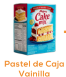
Pastel de Caja Vainilla

*Se puede utilizar cualquier marca de harina