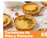
Tartaletas de Piña y Pistache 25