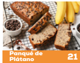
Panqué de Plátano 21