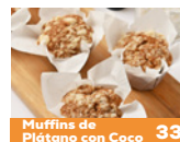
Muffins de Plátano con Coco 33