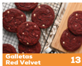
Galletas Red Velvet 13