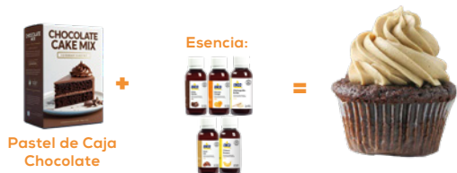
Pastel de Caja Chocolate