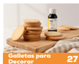
Galletas para Decorar 27