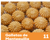
Galletas de Mantequilla 11