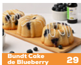
Bundt Cake de Blueberry 29