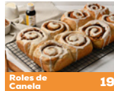
Roles de Canela 19