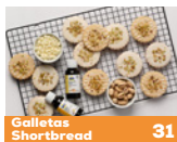
Galletas Shortbread 31